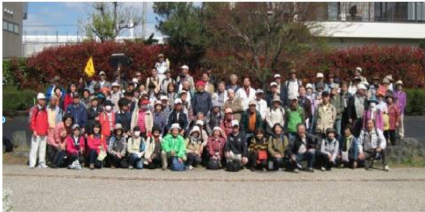
4/2 ウォーキング大会