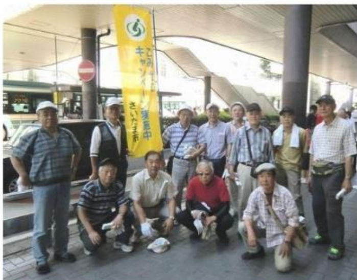
大宮中央校協議会 ごみゼロキャンペーン参加者