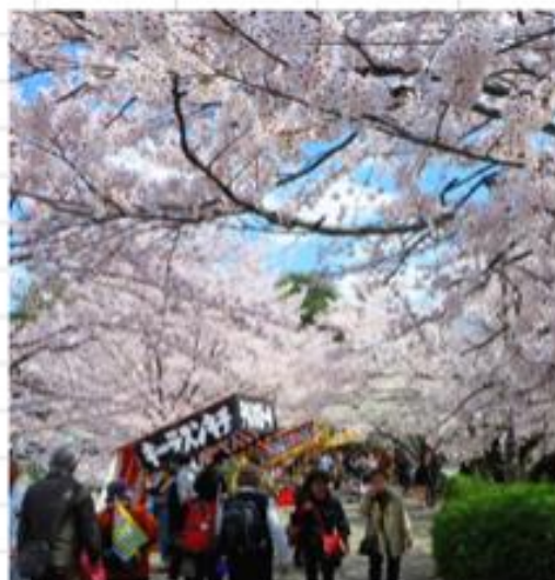
大宮公園内満開の桜