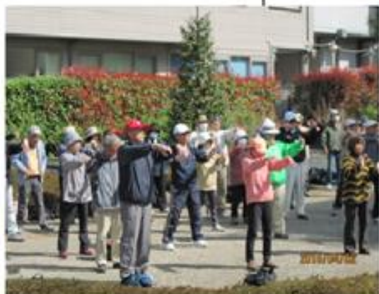
出発前に念入りの準備体操